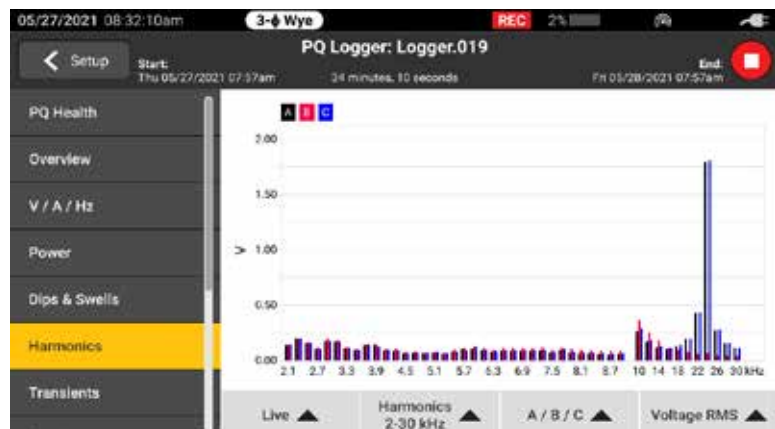
Una gamma completa di armoniche è disponibile dalle prime 50 armoniche intere e da 2 kHz a 30 kHz