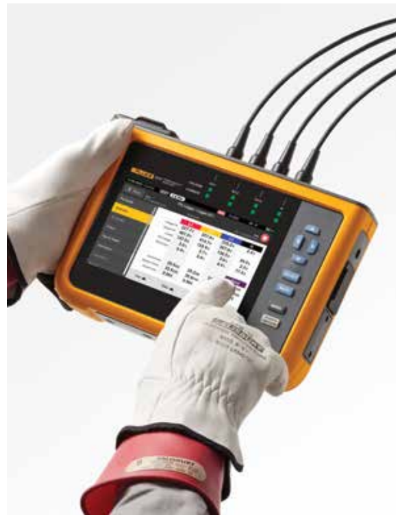
Naviga facilmente utilizzando l'ampio touchscreen a colori

Quando vengono scaricati i dati dagli analizzatori di Power Quality Fluke serie 1770, il pacchetto software Energy Analyze Plus incluso può confrontare i dati statistici delle armoniche di corrente e della tensione misurati con standard diversi, come EN 50160 o IEEE 519, per determinare se superano i limiti di conformità. Le potenti funzioni di manutenzione predittiva consentono di individuare le armoniche di corrente prima che la distorsione appaia sulla tensione; ciò consente di prevenire guasti imprevisti o situazioni di non conformità, aumentando così il tempo di funzionamento. Con la proliferazione dei carichi basati su invertitore e della generazione di potenza, mantenere le armoniche di corrente sotto controllo sta diventando sempre più importante per garantire una Power Quality affidabile ed evitare tempi di inattività del sistema.