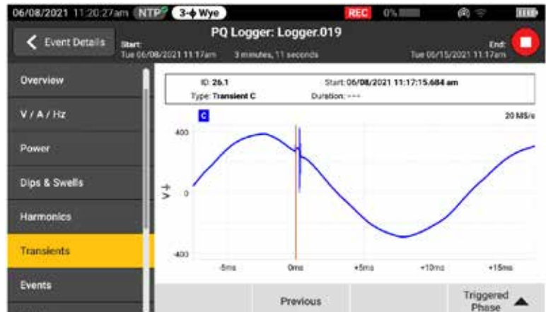
Visualizzazione in tempo reale degli eventi transitori di tensione durante la registrazione per una ricerca guasti più rapida

La serie Fluke 1770 è stata progettata per un uso semplice e sicuro in qualsiasi ambiente di misurazione. La serie 1770 consente di acquisire un intervallo completo di variabili di Power Quality, forme d'onda ad alta velocità, transitori ad alta velocità e armoniche a frequenza più elevata, tutte visibili subito sull'ampio schermo ad alta risoluzione. Con un valore nominale di sovratensione CAT IV 600 V / CAT III 1000 V all'avanguardia, questi analizzatori possono essere utilizzati all'ingresso del servizio o a valle, misurando ingressi CA e CC e armoniche con una capacità fino a 30 kHz. Con la serie 1770 avrete la certezza di acquisire i dati necessari per prendere decisioni migliori sulla manutenzione, indipendentemente dall'attività.