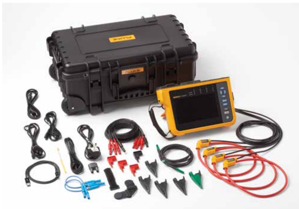
Analizzatore di Power Quality Fluke 1777. Nota: Gli articoli inclusi variano in base al modello e sono elencati nella tabella "Informazioni sull'ordine".