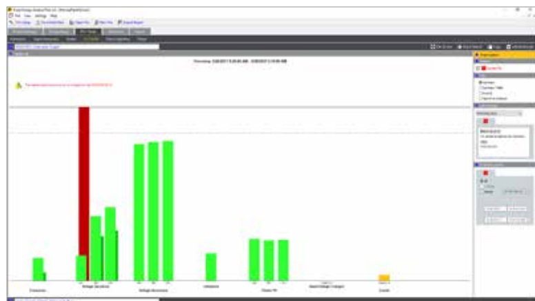
Fluke Energy Analyze Plus: riepilogo integrità Power Quality